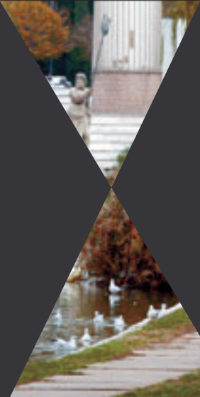
En el lago de España Industrial, donde se ha colocado el nuevo sistema de limpieza.